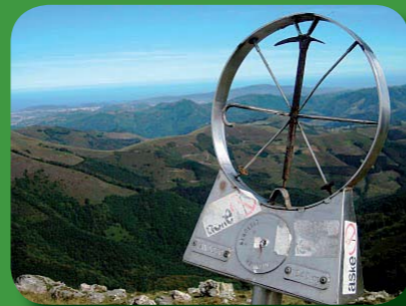
Mandogiko tontorra/Cima de Mandoegi/ Sommet d'Mandoegi