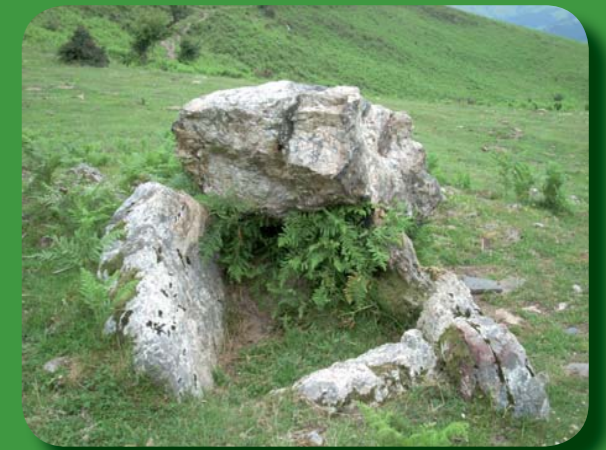
Añoneko trikuharria/Dolmen de Añone/Dolmen d'Añoñe