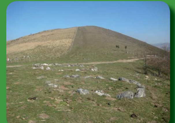
Errekalekuko mairu-baratzeak/Cromlechs de Errekaleku/ Cromlechs d'Errekaleku